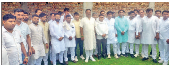
रेवाड़ी। अपनी मांगों का लेकर एकजुट हुए जिला पार्षद।

हरियाणा पार्षद एसोसिएशन के सदस्यों ने अपनी 12 सूत्रीय मांगों को लेकर पंचायत मंत्री महिपाल ढांडा से हरियाणा प्रभारी सतीश पुनिया की उपस्थिति में मुलाकात की और अपनी मांगों पर चर्चा करके मांग पत्र सौपा। मंत्री ने कैबिनेट की बैठक में सीएम से बात करके जल्द से जल्द मांगे पूरी कराने का भरोसा दिलाया। बैठक के बाद एसोसिएशन कॉर्डिनेटर ने निर्णय लिया कि अगर एक सप्ताह में मांगे पूरी नहीं होती है तो 18 जुलाई बुधवार को कर्नाल स्थित सीएम आवास के सामने धरना दिया जाएगा। एसोसिएशन के