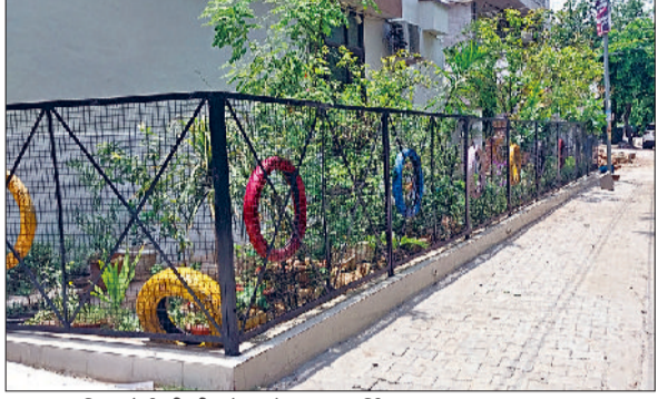
रेवाड़ी। हुडा बाइपास पर ग्रीन बेल्ट में कब्जा, सेक्टर-1 की ग्रीन बेल्ट में कब्जा, सेक्टर-3 हाउसिंग बोर्ड की ग्रीन बेल्ट में बनाया पार्किंग स्थल।

नहीं की गई हो। कमर्शियल कंस्ट्रक्शन पर पाबंदी लगाने की दिशा में नगर परिषद के अधिकारी अभी तक कोई कदम नहीं उठा पाए हैं। अब शहर की ग्रीन बेल्ट पर कब्जों की भरमार हो चुकी है। सेक्टर-3 हाउसिंग बोर्ड की ग्रीन बेल्ट में लोगों ने पक्के निर्माण करके कब्जे कर लिए हैं। यहाँ तक ग्रीन बेल्ट में चारों तरफ जालियां लगाकर गाड़ियों के लिए गैराज बना लिया है। लोगों ने बावल रोड, बाइपास, सेक्टर-1, सेक्टर-3, सेक्टर-4 व गढ़ी बोलनी रोड पर ग्रीन बेल्ट में 10 से 12 फीट तक कब्जे किए हुए हैं, लेकिन प्रशासन इन सब की अनदेखी करके मूक दर्शक बना हुआ है। नगर परिषद व