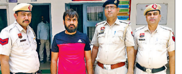
रेवाड़ी। पुलिस गिरफ्त में हत्या का आरोपी।