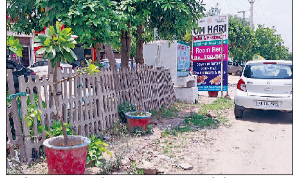
रेवाड़ी। हुडा बाइपास पर ग्रीन बेल्ट में कब्जा, सेक्टर-1 की ग्रीन बेल्ट में कब्जा, सेक्टर-3 हाउसिंग बोर्ड की ग्रीन बेल्ट में बनाया पार्किंग स्थल।

शहर के कई स्थानों पर मल्टी स्टोरीज बिल्डिंग बनाकर कमर्शियल कार्य किया जा रहा है। मॉडल टाउन एरिया में कमर्शियल बिल्डिंग बनाने की इजाजत तब तक नहीं दी जा सकती, जब तक की जमीन कमर्शियल में ट्रांसफर