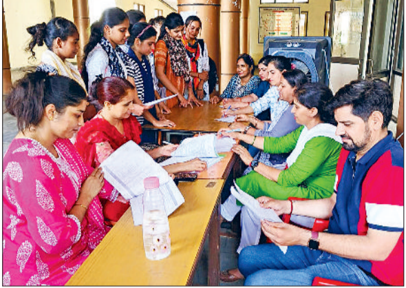
रेवाड़ी। गर्ल्स कॉलेज में कागजात जमा करती छात्राएं।

पहली मेरिट लिस्ट आने के बाद विद्यार्थी जिले के कॉलेजों में जल्दी दस्तावेज जमा कराने में लगे हुए हैं। वीरवार को दाखिले की दूसरी प्रोविजनल मेरिट लिस्ट जारी की गई। 12 जुलाई को कॉलेजों में दाखिले की फाइनल मेरिट लिस्ट जारी की जाएगी। द्वितीय मेरिट लिस्ट के विद्यार्थी 15 जुलाई तक फीस जमा करा सकेंगे। 17 जुलाई को पहली व दूसरी मेरिट लिस्ट के विद्यार्थियों की फिजिकल काउंसलिंग की जाएगी। इसके बाद 17 से 30 जुलाई तक फिर पोर्टल ओपन होगा, जिसमें वंचित विद्यार्थी दाखिला करा सकेंगे। इसी बीच 18 से 24 जुलाई तक 100 रुपये लेट फीस के साथ फिजिकल काउंसलिंग होगी। इसके बाद 25 से 30 जुलाई तक 100 रुपये लेट फीस के अलावा प्रतिदिन 100 रुपये अतिरिक्त चार्ज के साथ सीटों की फिजिकल काउंसलिंग की जाएगी।