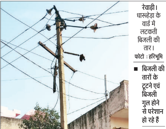
रेवाड़ी। धारुहेड़ा के वार्ड में लटकती बिजली की तार।