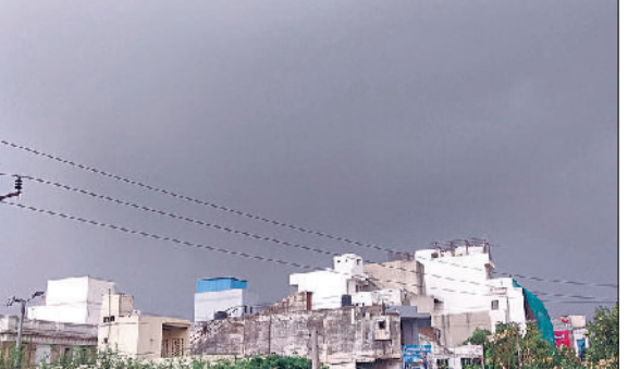
रेवाड़ी। वीरवार दोपहर बाद छाए बरसात के बादल।

हरिभूमि न्यूज ►► रेवाड़ी मौसम ने अचानक यू-टर्न ले लिया। मानसून शुरू होने के बाद तापमान में काफी कमी देखने को मिल रही थी। अचानक तापमान में भारी वृद्धि दर्ज की गई, जिससे लोगों को जून माह में चलने वाली गर्म हवाओं का अहसास हुआ। गर्म हवाओं के साथ आर्द्रता ने चिपचिपाहट भरी गर्मी से दिन भर लोगों को परेशान किया। तापमान में 22 दिन बाद यह वृद्धि दर्ज की गई है, जो सामान्य से 12 डिग्री सेल्सियस ज्यादा है। शाम तक आसमान में घने बादल छाए रहने से बरसात की संभावना भी बनी