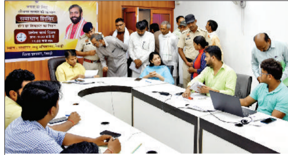
रेवाड़ी। समाधान शिविर में शिकायतें सुनते डीसी व एडीसी।

सामने शिकायत रखी गई, जिन्हें गंभीरतापूर्वक सुना गया और समाधान के निर्देश दिए गए। उन्होंने बताया कि अधिकतर शिकायतें बच्चों के जन्म प्रमाण पत्र व उनके अधिकारों व सरकारी योजनाओं के लाभ से संबंधित थीं। उन्होंने कहा कि समाज में दिव्यांग बच्चों के प्रति संवेदना जरूरी है। ऐसे बच्चों को समाज की मुख्यधारा से जोड़ना जरूरी है।