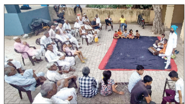
रेवाड़ी। लोगों को सरकार की जनकल्याणकारी नीतियों बताते कलाकार।

जिले में सूचना, जनसंपर्क, भाषा और संस्कृति विभाग हरियाणा की भजन पार्टियों विशेष प्रचार अभियान में जुटी हुई हैं। भजन पार्टी गांव-गांव जाकर नागरिकों को सरकारी योजनाओं के अलावा सामाजिक विषयों पर आमजन को जागरूक कर रही हैं। वीरवार को विभागीय व सूचीबद्ध भजन पार्टी ने बिन रिश्त के मिले नौकरी सीएम सै ईमानदार मेरे हरियाणे में...सहित अनेक गीतों के माध्यम से ग्रामीणों को सरकारी योजनाओं से रूबरू