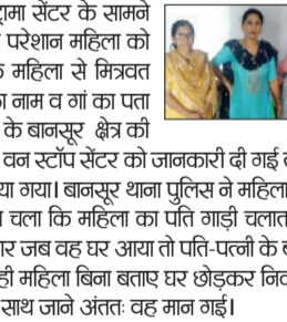
रेवाड़ी। महिला को समझा कर परिजनों के साथ जाने अंततः वह मान गई।

रेवाड़ी। महिला थाना पुलिस की ओर से दामा सेंटर के सामने स्थित वन स्टॉप सेंटर में मानसिक रूप से परेशान महिला को छोड़ा गया। सेंटर संचालिका ने बताया कि महिला से मित्रवत व्यवहार करते हुए पूछने पर अपने पति का नाम व गां का पता बताया। महिला राजस्थान के अलवर जिले के बानसूर क्षेत्र की थी। वन स्टॉप सेंटर की ओर से अलवर के वन स्टॉप सेंटर को जानकारी दी गई तथा उनकी मदद से बानसूर थाना में संपर्क किया गया। बानसूर थाना पुलिस ने महिला के पति रिश्तेदारों से बात की। पूछताछ में पता चला कि महिला का पति गाड़ी चलाता है और अलवर घर से बाहर रहता है। इस बार जब वह घर आया तो पति-पत्नी के बीच झगडा हो गया था। पति के काम पर जाते ही महिला बिना बताए घर छोड़कर निकल गई। महिला को समझा कर परिजनों के साथ जाने अंततः वह मान गई।