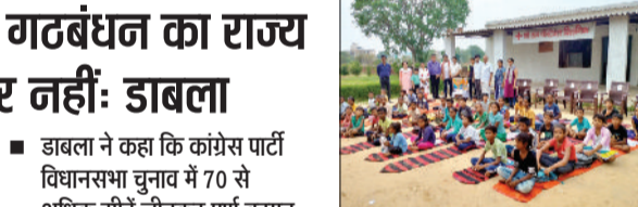
रेवाड़ी। केंद्र में विद्यार्थियों के साथ शाखा सदस्य।